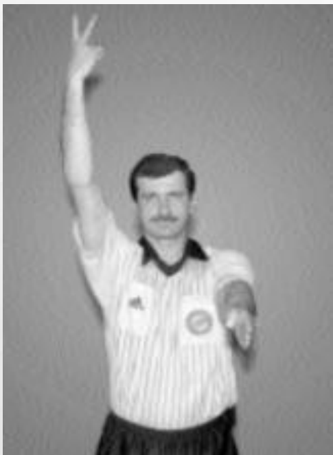
WYKLUCZENIE ( 2 MINUTY)