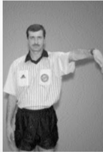
RZUT OD BRAMKI