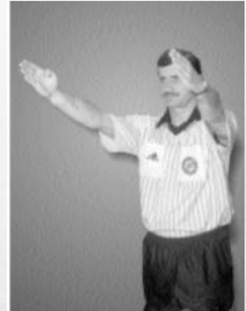
RZUT Z LINII BOCZNEJ- KIERUNEK