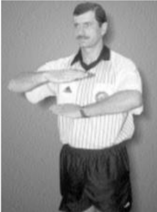
BŁĄD KROKÓW LUB 3 SEKUND