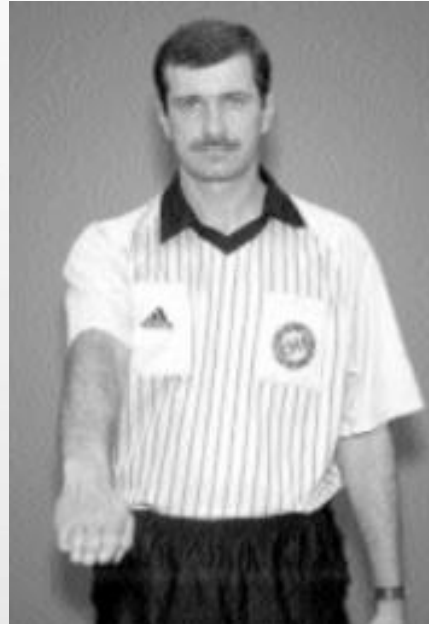
NARUSZENIE POLA BRAMKOWEGO