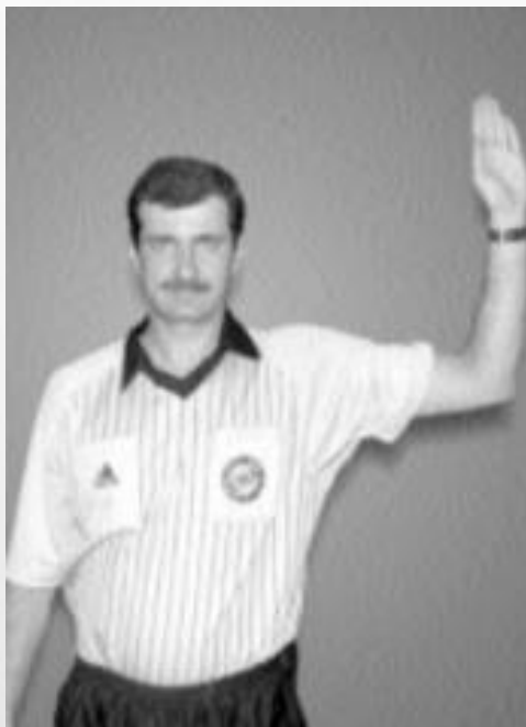
OSTRZEŻENIE O GRZE PASYWNEJ