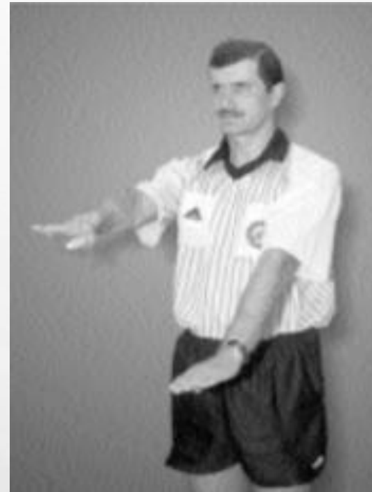
PODWÓJNY CHWYT, BŁĄD ODBICIA I KOZŁOWANIA